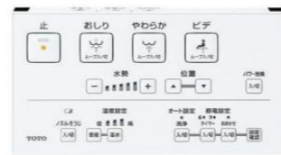
ウォッシュレット用リモコン