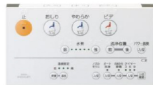
ウォシュレット用リモコン